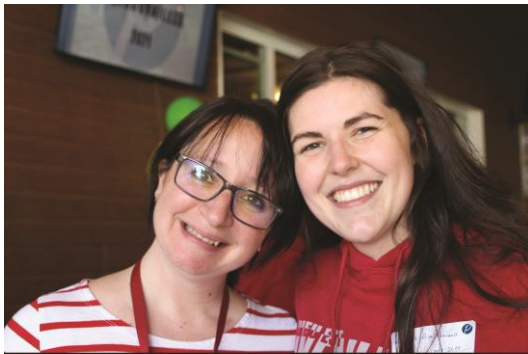
Journée Retrouvailles / Reunion Day