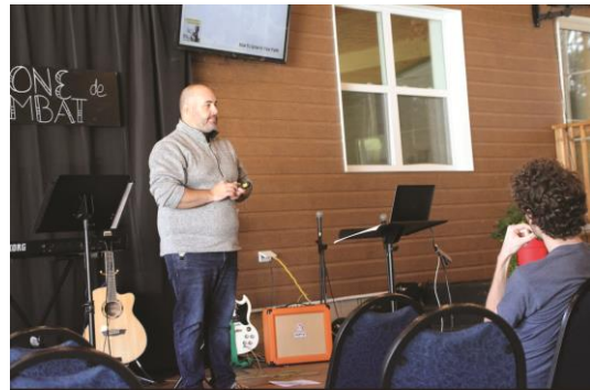
Zone de combat / Battle Zone